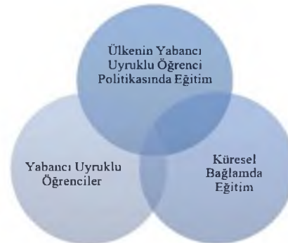
Şekil 1. Eğitim Diplomasisinin Boyutları (Akar & Gürkaynak, 2022, s. 146)

Öğrenci ve akademisyen değişim programları, dil enstitüleri, uluslararası iş birlikleri ve burslar bu noktada önemli örnekler olarak görülebilir. Yabancı öğrencilerin geldikleri ülkeye karşı ilgi ve anlayış geliştirmelerinde